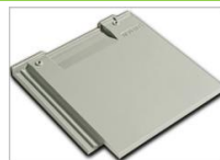
นิวสโตร์ เกรย์แกรนิต