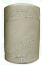
ถังเก็บน้ำ 2,000 ลิตร DOS DE-01