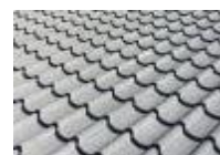
Metalsheet 0.4มม.พ่นสโตนชิป

Green+ นิวสโตร์ เกรย์แกรนิต (Grey Granite)หรือเทียบเท่า