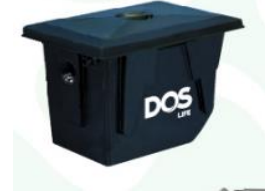
ถังดักไขมัน ฝังใต้ดิน DOS GT-02/BK-40L

10.4 ท่อระบายน้ำซีเมนต์ใยหิน 8 " ความยาวไม่เกิน 30 ม.