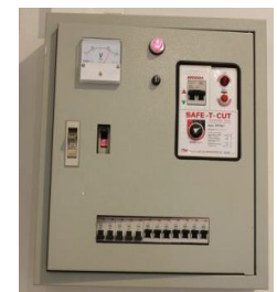
ตู้คอนโทรล 1 หรือ 3 เฟส+ เซฟตี้คัท